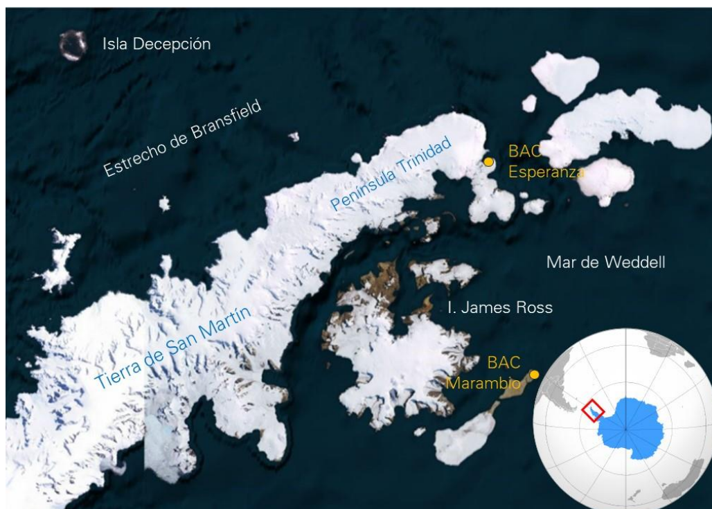
Figura 1. Ubicación de bases antárticas argentinas en las cuales se realizó el estudio.

Se trabajó con muestras de agua procedentes de diferentes fuentes de captación y distribución para consumo del personal de dotación y producción hidropónica en las BAC Esperanza (Lat. -63,3983^{\circ} ; Long. -56,9961^{\circ} ; 5 msnm) y Marambio (Lat. -64,2444^{\circ} ; Long. -56,6067^{\circ} ; 201 msnm), durante el invierno de 2022 (Figura 1). La primera se encuentra en la bahía Esperanza (Hope bay), península Trinidad, en el extremo NE de la Tierra de San Martín y cuenta con una dotación permanente de aproximadamente 66-80 personas que asciende, en la época estival, a un promedio de 142 incluyendo niños. La segunda se encuentra en la meseta alta de la isla Marambio (ex Seymour), integrante del grupo de islas de James Ross sobre el mar de Weddell, también en la península Trinidad. Su población consiste en una dotación permanente de 75-80 personas que se amplía a unas 160-180 durante el verano.