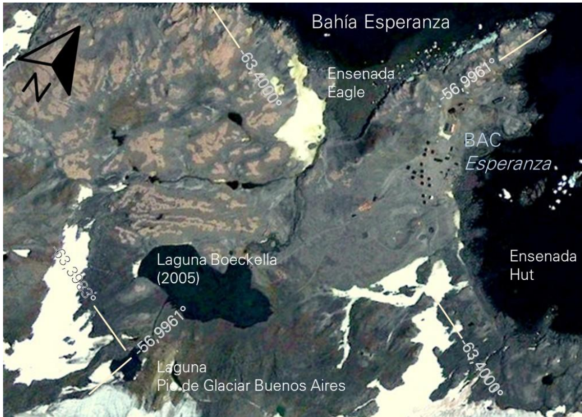
Figura 2. Ubicación de la fuente de agua actual (E-PGBA) en la BAC Esperanza.