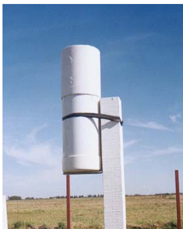
Figura 4. Pluviómetro experimental.

De acuerdo a estos requisitos se construyó en las instalaciones que posee el INA-CRL, en Santa Fe un pluviómetro prototipo de PVC, el cual se puede observar en la figura 4.