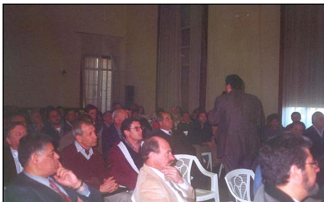
Figura 2. Taller de lanzamiento.