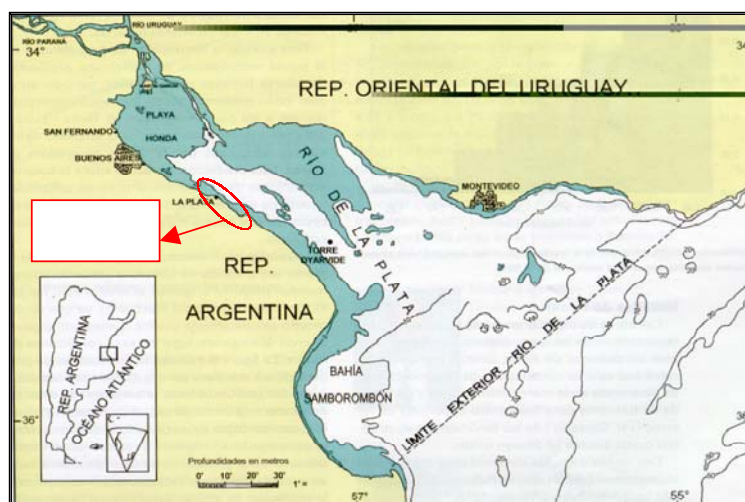
Figura 1: Ubicación del área de estudio

El Río de la Plata representa la salida de la cuenca del mismo nombre, que abarca parcialmente los territorios de Argentina, Bolivia, Brasil, Paraguay y Uruguay. Es el resultado del aporte de dos grandes ríos, el Paraná con un caudal del orden de los 17.000 m 3 /s y el Uruguay con un caudal aproximado de unos 5.000 m 3 /s, y que acarrearán una gran cantidad de material en suspensión, lo que le confiere a sus aguas un color amarillado característico. Su escasa profundidad media constituye un factor negativo para su autodepuración. Sin embargo, también existen características que favorecen dicho proceso: la riqueza y variedad del plancton, su importante caudal y su gran dinámica (AGOSBA-OSN-SIHN,1992).